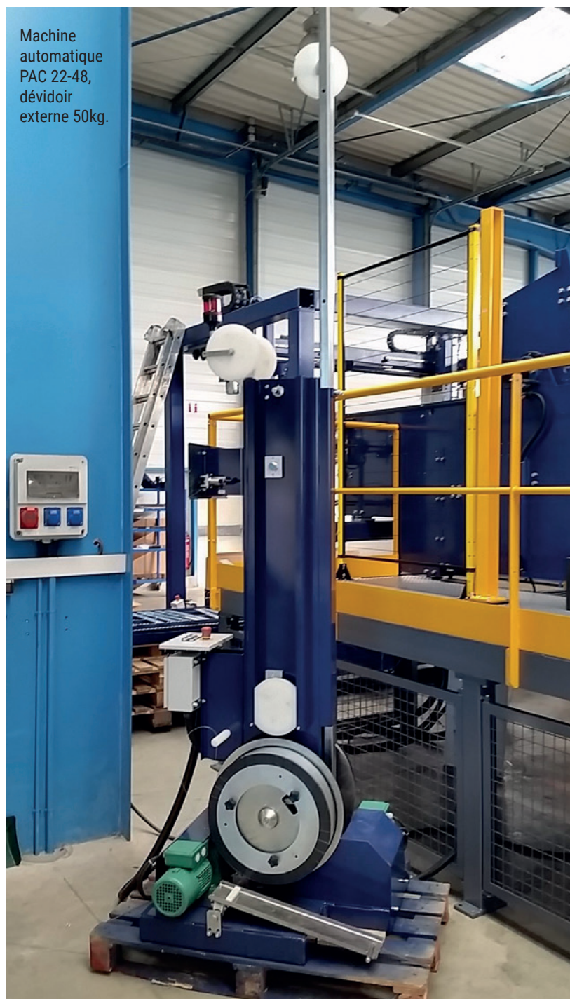
Machine automatique PAC 22-48, dévidoir externe 50kg.