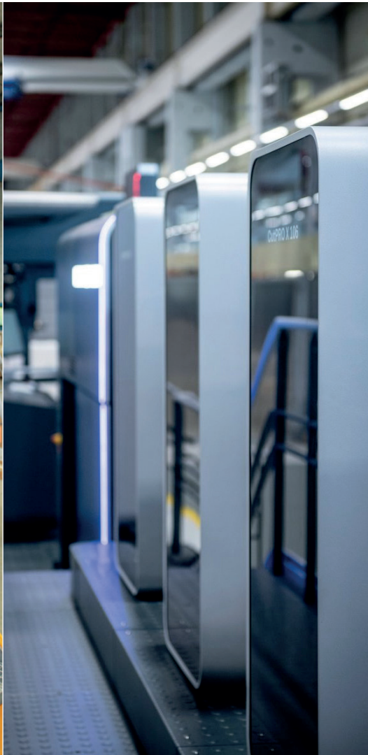
Nouvelle CutPRO X 106 Koenig & Bauer : un pas de géant dans le post- press packaging