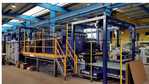
Machine automatique PAC 22-48, elle gère l'introduction, le pliage, l'agrafage, la palettisation avec un seul opérateur, elle permet de produire jusqu'à 1100 caisses à l'heure 2,20m X 4,80 m et jusqu'à la triple cannelure.