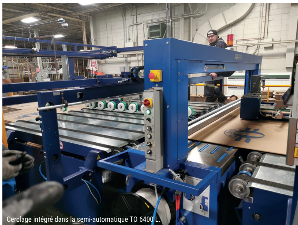
Cerclage intégré dans la semi-automatique TO 6400 L.

Une question essentielle au regard de la position dominante de la société sur le marché face à des concurrents plus gros comme Bobst ou BGM, et qui l'oblige sans cesse à s'adapter. Avec « seulement » 20 à 25 machines par an (dont la PAC40 qui réalise, en automatique, des caisses jusqu'à quatre mètres, et sa grande sœur PAC48 qui peut aller jusqu'à 4,80m), Gazzella Atlantique peut quand même se targuer d'être présente sur les cinq continents. Une opportunité due à la fois à un savoir-faire reconnu, une communication maîtrisée, mais aussi à un sens de l'adaptation poussé si l'on en juge par les variations de température auxquelles l'entreprise a dû parfois affronter, passant de 40°C en Arabie Saoudite à moins 20°C en Russie. Andrea Torcellan le reconnaît volontiers : « Travailler dans le monde entier apporte des complexités pas évidentes » Pour gérer ce type de situations, et en cibler d'autres comme les « problématiques de tension et d'alimentation de courant », Gazzella Atlantique a « inclus dans les machines une capacité d'adaptation n'importe où dans le monde » par le biais d'auto transformateurs.